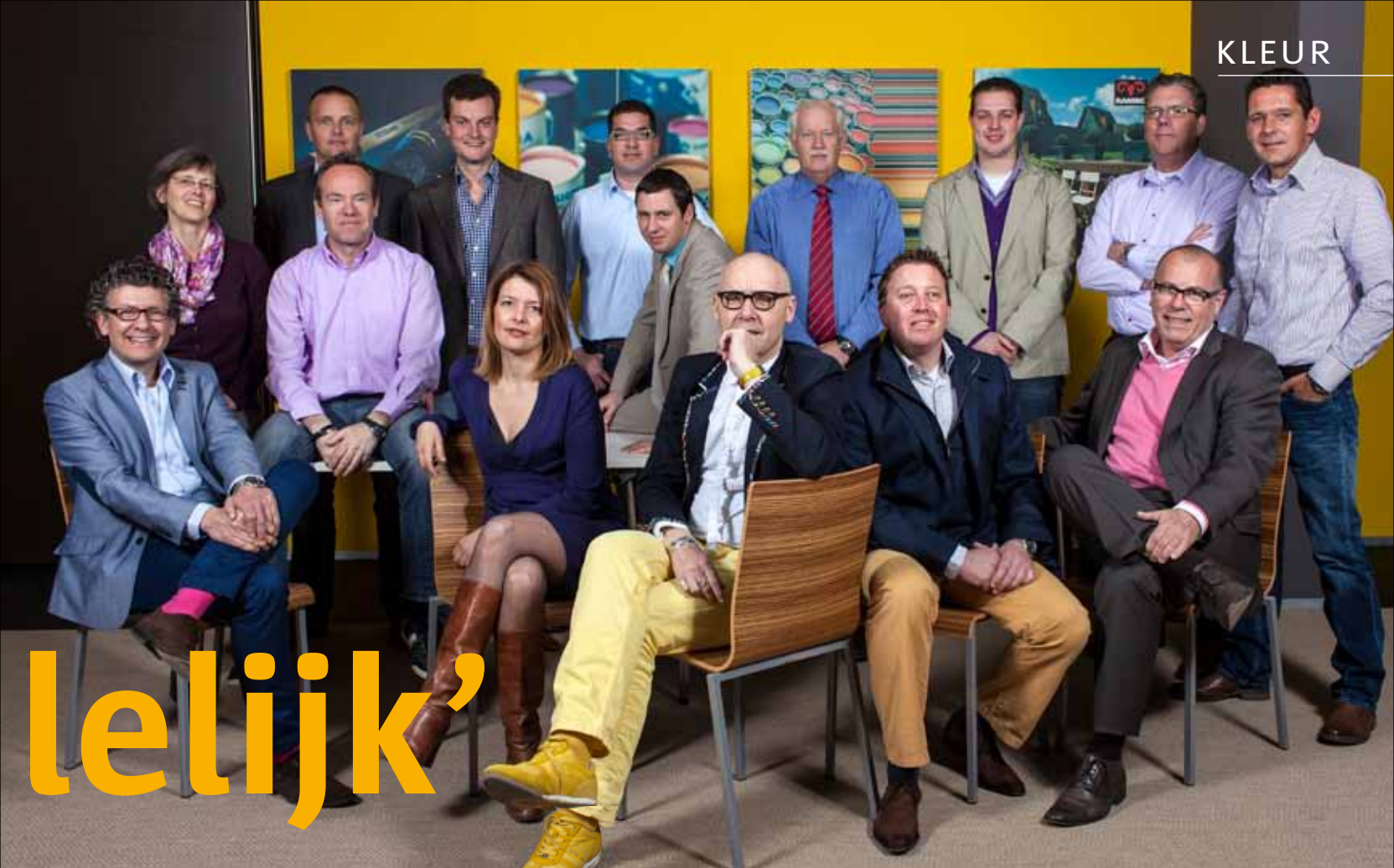
De kleurexperts van Sigma Coatings

En dan de don'ts . Laat je niet van tevoren beïnvloeden door ideeën van anderen. Voor opdrachtgevers is het bijvoorbeeld belangrijk dat het schilderwerk praktisch is voor onderhoud. Dat is zeker belangrijk, maar stel je vooral blanco op. Ten tweede: stuur het kleurplan nooit zonder uitleg naar de opdrachtgever. Onderbouw de adviezen zoveel mogelijk persoonlijk. Niets is bij voorbaat fout, als je het maar kunt uitleggen. Roep in ieder geval niet zomaar een kleurnummer om er maar vanaf te zijn. Een goed kleuradvies is waardevol en is een mooie aanvulling op het Sigma-dienstenpakket! ♦